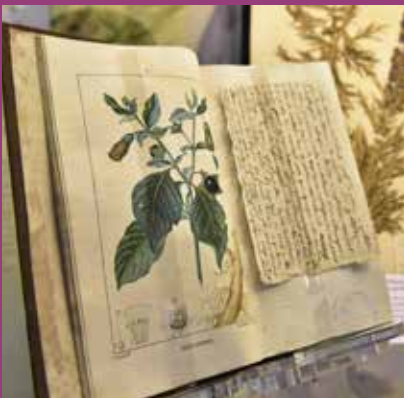
OCTOBRE «Les plantes, un monde en mouvement», BU Sciences