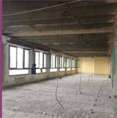
AOÛT Début des travaux d'extension, BU Lyon Sud