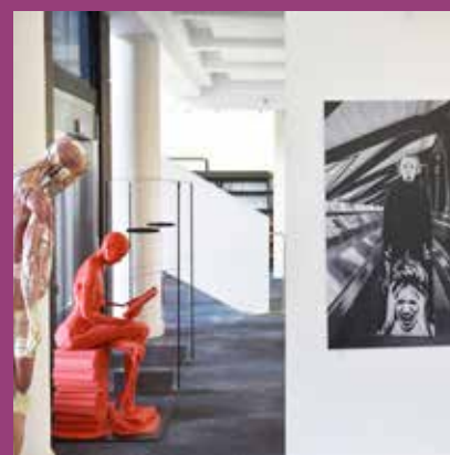
JUIN Exposition sur la fibromyalgie, BU Santé Rockefeller