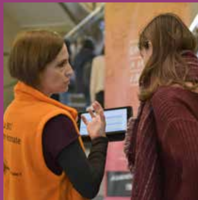
NOVEMBRE Enquête de satisfaction dans toutes les bibliothèques