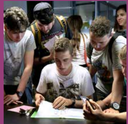
SEPTEMBRE Escape Game, semaine d'intégration, BU Sciences