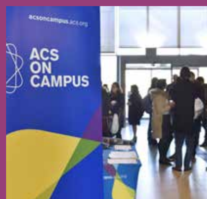
MARS Rencontre ACS on campus, BU Sciences