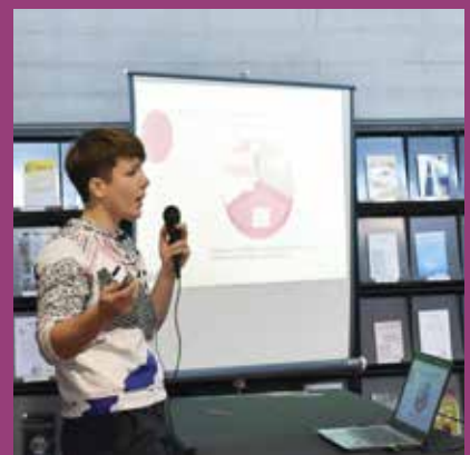
DECEMBRE BARCamp, BU Education Lyon Croix-Rousse