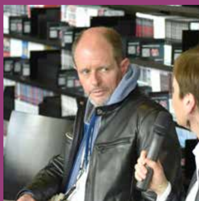
AVRIL Rencontre avec Bernard Minier, Quais du polar, BU Sciences