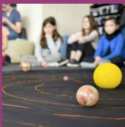
FEVRIER Festival Science et Manga «La tête dans les étoiles», BU Sciences