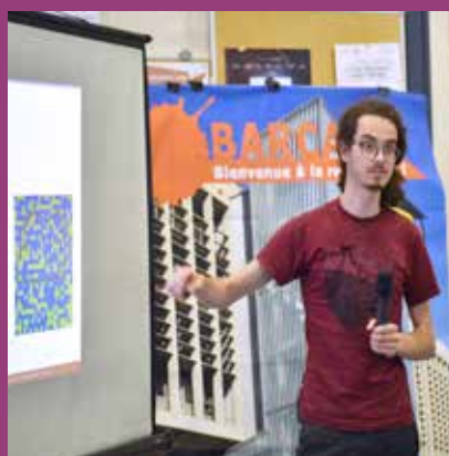
MAI BARCamp, BU Maths