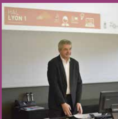
JANVIER Ouverture officielle de l'archive ouverte HAL Lyon 1